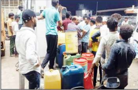
पद्मेश न्यूज। लालबारी।

आधुनिक खेती पर लगा 'ब्रेक', डिब्बों में डीजल न मिलने से खेतों में ही थम गये ट्रैक्टर ट्रैक्टर चालकों ने प्रशासन से पेट्रोल पंपों में स्टॉक रखकर पर्याप्त मात्रा में डिब्बों में डीजल देने की मांग की