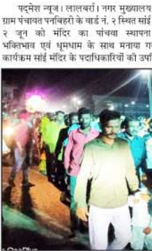
पद्मेश न्यूज। लालबारी। नगर मुख्यालय में सटी ग्राम पंचायत पनबिहारी के वार्ड नं. २ स्थित साईं मंदिर में २ जून को मंदिर का पांचवा स्थापना दिवस भक्तिभाव से धूमधाम के साथ मनाया गया।

पनबिहारी से शिर्डी वाले साईं बाबा की निकाली गई पालकी यात्रा