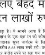
पड़ा है। ये सामने आया है कि खाबड़ के एक-एक रन की कोमत लखनऊ सुपर जयंट्स के लिए 7 करोड़ 8.65 लाख रुपये रही। उन्हें 27 करोड़ रुपये पर रखा गया था। कप्तान 14 मैचों में कुल 31 रन बनाए। एक बल्लर देखा जाये तो उनका प्रति रन 8,65,384 रुपये का रहा है। पिछले साल आईपीएल 2025 की मेग नीलामी में फ्रैंचाइजी ने खाबड़ को 27 करोड़ रुपये में खरीदा था। उस सत्र में, उन्होंने 14 मैचों में केवल 269 रन बनाए। इन ऑफरों के अलावा पर 2025 में उन प्रत्येक रन को 2025 में 10 लाख 3 हजार 717 रुपये से भी अधिक रही थी, जिसने उनका हर एक रन लाखों रुपये का