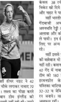
बनाये। वहीं हीथर नाइट ने 42 गेंदों में 10 चौके लगाकर नकार 70 रन बनाये। लक्ष्य का पीछा करते हुए मेजबान टीम इंग्लैंड के शुरुआत अच्छे नहीं रही थी। उसने केवल 38 रनों पर ही अपने 3 विकेट खो दिये। इसके बाद कैप्सी और नाइट ने पारी को संभाला। यहाँ भारतीय टीम को तरफ से गेंदबाजी अच्छी नहीं रही। अरुणथिन रेड्डी और क्विंटिन गैट्टे के अलावा और कोई भी विकेट नहीं ले पायीं। इन दोनों ने 2-2 विकेट लिए पर अन्य गेंदबाज असफल रहे। वहीं इससे पहले भारतीय टीम की बल्लेबाज भी उम्मीद के अनुसार नहीं रही। कप्तान इरमनप्रीत कौर ने 40 गेंद में नाबाद 56 रन बनाकर टीम को 180 रन तक पहुंचाया। इरमनप्रीत के अलावा टीम यशिका भाटिया और टीमि शर्मा ने 32-32 व जेमिमा रॉड्रिग्स ने 29 रन बनाये। वहीं अन्य बल्लेबाज असफल रहीं।

टांटा। इंग्लैंड की महिला क्रिकेट टीम ने भारतीय टीम को तीसरे टी20 मुकाबले में 6 विकेट से हराकर तीन मैचों की सीरीज 2-1 से जीत ली है। इंग्लैंड टीम को जीत में एलिजा कैप्सी और हीथर नाइट ने मुख्य भूमिका निभाई। इन दोनों ने ही अर्धशतकीय पारियां खेलीं। इस मैच में भारतीय महिला टीम ने पहले बल्लेबाजी करते हुए कप्तान इरमनप्रीत कौर के अर्धशतक 56 रनों को पारी से निर्धारित 20 ओवरों में 180 रन बनाया थे। इसके बाद मेजबान टीम ने ये लक्ष्य 18.3 ओवर में ही 184 रन बनाकर हासिल कर लिया। इंग्लैंड की ओर से कैप्सी ने 43 गेंदों में 9 चौके और 3 छक्के लगाकर सबसे अधिक 82 रन