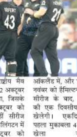
शुरुआत में पांच टी20 अंतरराष्ट्रीय मैच खेलेगी। पहला टी20 मुकाबला 22 अक्टूबर को काइस्टर्चर्च में खेला जाएगा, जिसके बाद दूसरा टी20 भी 24 अक्टूबर को उसी मैदान पर खेला जाएगा। वहीं सीरीज का तीसरा मैच 27 अक्टूबर को वेल्डिंग्टन में और चौथा टी20 30 अक्टूबर को

ऑकलैंड। न्यूजीलैंड क्रिकेट बोर्ड ने इस साल के अंत में भारतीय क्रिकेट टीम के खिलाफ होने वाली घरेलू सीरीज के लिए कार्यक्रम घोषित कर दिया है। भारतीय टीम अक्टूबर में न्यूजीलैंड दौर पर पहुंचेगी जहां दो पांच टी20, पांच एक दिवसीय अंतरराष्ट्रीय और दो टेस्ट मैचों को एक लंबी सीरीज खेलेगी। इस प्रकार कुल 12 मुकाबले पांच अलग-अलग स्थलों पर खेले जाएंगे, जिसको शुरुआत 22 अक्टूबर से होगी और यह 1 दिसंबर तक चलेगी। यह पहली बार होगा जब न्यूजीलैंड क्रिकेट टीम अपनी घरेलू पर भारत के खिलाफ एक साथ तीन अलग-अलग प्रारूप में 12 अंतरराष्ट्रीय मैच खेलेगी। भारतीय टीम साल 2019 के बाद पहली बार न्यूजीलैंड की घरेलू पर दो टेस्ट सीरीज के लिए पहुंचेगी। साल 2022 के बाद यह भारतीय टीम का पहला सीमित ओवरों का दौर होगा। भारतीय टीम अपने न्यूजीलैंड दौर को