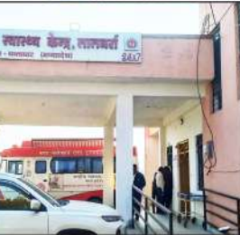
विवाद दोनों पक्षों के बीच हुआ था इसलिए पुलिस ने दोनों पक्षों को रिपोर्ट पर काउंटर मामला पंजीकृत कर मामले की जांच शुरू कर दी गई है।