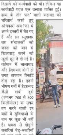
आल इंडिया टुरिस्ट परमीट बसों के संचालन को लेकर महत्वपूर्ण संशोधन किए गए थे, जो 01 अप्रैल 2026 से लागू हो चुके हैं।