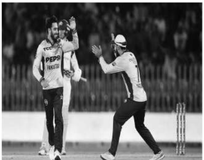
ओर सलमान आगा ने एक-एक विकेट लिए।

इस मैच में टॉस हाकर पहले बल्लेबाजी करते हुए ऑस्ट्रेलियाई टीम को शुरूआत खराब रही और वह 44.1 रन पर ही 200 रनों पर आउट हो गयी। मिन्हास ने अपने पहले ही मैच में 10 ओवर में केवल 32 रन देकर 5 विकेट लिए। उन्होंने म्यूथ शॉर्ट 55, जोश इंग्लिस 13, के अलावा मारनस लावुसिन और कैमरून टॉनो का हो जवाब देना ही बेवैलियन बल्ले बर दिया। ऑस्ट्रेलिया की ओर से केवल रेट नैन्सॉ ही 65 रन बना पाए। मैथ शॉर्ट 5.11 रन बनाए। पाकिस्तान की ओर से अहमद अहमद ने दो, जबकि शाहीन अफ़रीदी, हासिर रऊफ