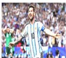
फि उम केवल एक संख्या है, इससे उनके खेल की गुणवत्ता पर प्रभाव नहीं हुआ है। मेसी ने बढ़ती उम्र में उनपर पड़ रहे विपरीत प्रभाव को जाँच को असाधारणतः बनाया है। साथ ही, दिखाया है कि उनके दिमाग में अभी भी यही पुरानी धार और जीतने की भूछ है, वे उन्हें उन्हें सर्वकालिक महान खिलाड़ियों की सूची में शीर्ष

कैनसस सिटी। मौजूदा चैंपियन अर्जेंटीना के कप्तान लियोनेल मेसी ने फीफा विश्वकप फुटबॉल में अल्बार्जिया के खिलाफ शानदार हैट्रिक लगाकर अपनी टीम को 3-0 से बढ़ती जीत दिलायी है। 39 की उम्र में लगायी इस हैट्रिक से मेसी ने ये सफल कर दिया कि बढ़ती उम्र के बावजूद भी उनके प्रदर्शन पर असर नहीं पड़ा है। मेसी के इस असाधारण प्रदर्शन के कारण ही फुटबॉल में असासनी से अर्जेंटीना को 3-0 से हरा दिया। मेसी के इस प्रदर्शन को देखकर फुटबॉल विश्वभरोंकों और प्रेसोंमें ही हैरानी जागोयी है। साथ ही पूछा है कि क्या बढ़ती उम्र का भी मेसी पर साध्य असर नहीं हो रहा है। वहीं एक आंशिकतः सकारात्मक कि विश्व कप में हैट्रिक लगाया अपने आप में बढ़ी बात है पर जब आप लगभग 39 वर्ष के हो और तब ऐसा करानाया करूँ, तो यह पूरी तरह से अविश्वसनीय लगता है। मेसी ने एक बार फिर दिखा दिया है