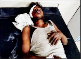
प्राथमिक उपचार के बाद जिला अस्पताल बालाघाट रेफर किया गया है।