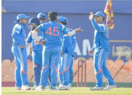
अफगान टीम को जीत के लिए 350 रनों का कठिन लक्ष्य मिला। इस मैच में पहले बल्लेबाजी करने उतरी भारतीय टीम को 22 गेंदों में 44