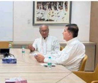
हमारे मार्गदर्शक और अभिभावक हैं। उनका अपमान हमारा व्यक्तिगत अपमान है। इसके बाद सामने फिर चाहे वह कोई भी बड़ा नेता क्यों न हो, हमारे लिए उसका है। उनका अपमान हमारा व्यक्तिगत अपमान है। इसके बाद सामने फिर चाहे वह कोई भी बड़ा नेता क्यों न हो, हमारे लिए उसका है।