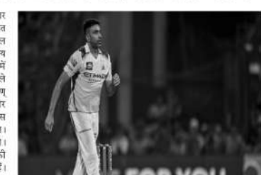
पयोंज ऊर्जा है, तो उन्हें मैदान पर रखना और उनके अनुभव का इस्तेमाल करना पूरी तरह से संभव है। उन्होंने अपनी बात को आगे बढ़ाते हुए कहा, मैं कोई विशेषज्ञ नहीं हूँ और यह बात पूरी अधिकार से नहीं कह सकता पर अगर खिलाड़ियों के लिए एक सही रिहैब प्रोग्राम बनाया जाए और उन्हें प्रबंधन से सकारात्मक संकेत मिलें, तो वे इसे जरूर कर दिखायेंगे। वहीं अश्विन ने आगाह

चेन्नई । दिग्गज स्पिनर आर अश्विन का मानना है कि रोहित शर्मा और विराट कोहली को साल 2027 में होने वाले एकदिवसीय विश्व कप क्रिकेट टूर्नामेंट में खेलना चाहिए। विश्वकप आने साल अक्टूबर-नवंबर में दक्षिण अफ्रीका, दक्षिण्य और नामीबिया में खेला जाएगा। उस समय तक रोहित जहाँ 40 साल। वहीं विराट 39 साल के हो जायेंगे। इसी को लेकर इन दोनों को फिटनेस को लेकर सवाल उठें हैं। वहीं दूसरी ओर अश्विन का कहना है कि इन दोनों ही स्टार खिलाड़ियों को साल 2027 के विश्व कप में जरूर खेलना चाहिए।