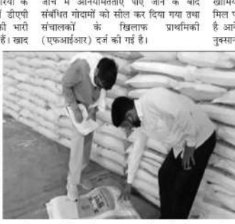
जानें कि अनियमितताएं पाए जाने के बाद संबंधित गोदामों को सील कर दिया गया तथा संचालकों के खिलाफ प्रारंभिक कार्यवाही आदेश जारी की गई है।