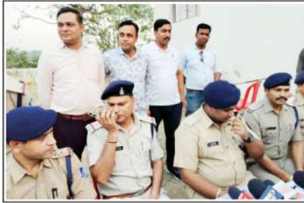
सफलतापूर्वक खुलासा कर लिया गया है।