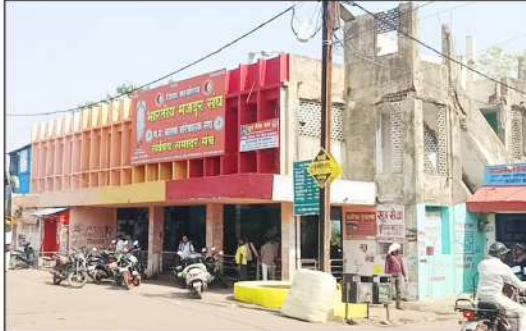
सिटी रिपोर्टर्स पद्मेश न्यूज़। बालाघाट।

भीषण गर्मी में पंखे बंद, कंठ तर करने पानी तक नहीं, गंदगी और दुर्गंध से सराबोर माहौल, यात्री परेशान