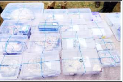
अरोपियों को हिरासत में लेकर पूछताछ की गई।