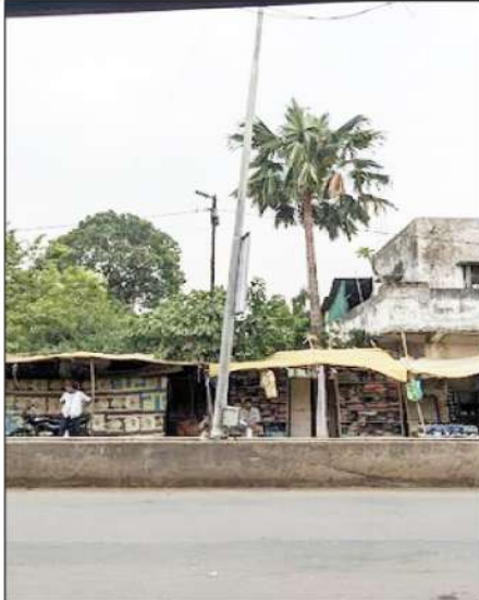
विद्युत पोलों को लेकर भी गंभीर सवाल विद्युत पोलों की स्थिति को लेकर