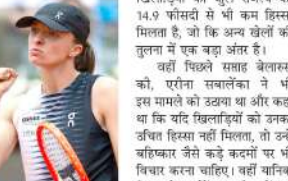
पेगुला ने संकेत दिया कि आज प्रमुख पेशेवर खिलाड़ियों को तुलना में टेनिस खिलाड़ियों को उनके योगदान के बिना काफी कम हिस्सा मिलता है।

ध्यान नहीं देते पर बड़ी संख्या में खिलाड़ी पूरी तरह से समर्थन में हैं। यह पुरुष और महिला दोनों वर्गों के खिलाड़ियों से लगातार संपर्क कर रही हैं और उन्हें इस अभियान में शामिल कर रही हैं। पेगुला ने संकेत दिया कि आज प्रमुख पेशेवर खिलाड़ियों को तुलना में टेनिस खिलाड़ियों को उनके योगदान के बिना काफी कम हिस्सा मिलता है। उन्होंने एमएफएलए (वैश्विक फुटबॉल लीग) और एनएचएलए (नैशनल हॉकी लीग) जैसे लीगों का उदाहरण देते हुए कहा कि उन्में खिलाड़ियों को लीग के कुल राजस्व का लगभग 50 फीसदी हिस्सा मिलता है। इसके विपरीत, अधिकतर टेनिस दुर्गमिंदों में खिलाड़ियों का यह हिस्सा बहुत कम रहता है। खिलाड़ियों द्वारा जारी एक प्रश्न के अनुसार, फेंच ओपन जैसे प्रसिद्ध दुर्गमिंद में भी खिलाड़ियों को कुल राजस्व का 14.9 फीसदी से भी कम हिस्सा मिलता है, जो कि अन्य खेलों की तुलना में एक बड़ा अंतर है। वहीं पिछले मसाह बेलासस में, एरिना सव्बालेनका ने भी इस मामले को उठया था और कहा था कि यदि खिलाड़ियों को उनका उचित हिस्सा नहीं मिलता, तो उन्हें बहिष्कार देने के बजाय कदमों पर भी विचार करना चाहिए। वहीं यानिक सिमर ने दुर्गमिंद आयोजकों को खिलाड़ियों के प्रति सम्मान की कमी का आरोप लगाया था। पेगुला ने इन दोनों शीर्ष खिलाड़ियों के समर्थन की सराहना करते हुए कहा कि जब दुनिया के नंबर-1 खिलाड़ी किसी मुरे पर खुदकर बोलते हैं, तो उनकी बात को नजरअंदाज करना असंभव हो जाता है। उनका समर्थन इस अभियान को एक मजबूत अलाव देता है।