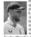
इंग्लैंड क्रिकेट टीम के टेस्ट कप्तान जेन स्टोक्स ने चोट से वापसी करते हुए काउंटी चैम्पियनशिप में अपनी गेंदबाजी कर साबित कर दिया है कि वह अंतरराष्ट्रीय क्रिकेट के लिए पूरी तरह से फिट हैं।