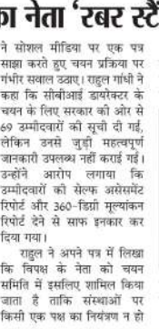
को भूमिका केवल 'रबर स्टैप' बनकर रह जाएगी। उन्होंने केंद्र सरकार पर

नई दिल्ली। प्रधानमंत्री आवास पर मंगलवार को हुई उच्चस्तरीय बैठक के बाद लोकसभा में नेता प्रतिपक्ष राहुल गांधी ने नए सीबीआई डायरेक्टर के चयन को लेकर अपनी असहमति जताई है। राहुल गांधी ने आरोप लगाया कि चयन प्रक्रिया को महत्व औपचारिकता बनकर रख दिया गया है और विपक्ष की भूमिका को नजरअंदाज किया जा रहा है। प्रधानमंत्री आवास 7, लोक कल्याण मार्ग पर हुई इस बैठक में प्रधानमंत्री नरेंद्र मोदी, भारत के मुख्य न्यायाधीश जस्टिस सुरेंद्र कुमार और राहुल गांधी शामिल थे। बैठक के बाद राहुल गांधी