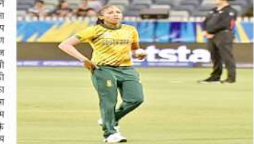
दक्षिण अफ्रीकी महिला तेज गेंदबाज शबनम इस्माइल ने खेल में वापसी की घोषणा कर दी है। शबनम की वापसी से दक्षिण अफ्रीकी टीम का गेंदबाजी आक्रमण बेहतर हुआ है।