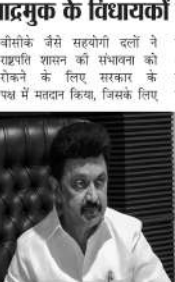
स्टालिन ने दोनों निर्णयों का समान व्यवहार किया। हालांकि, स्टालिन ने आरोप लगाया कि अब टीवीके सरकार उन लोगों का भरोसा तोड़ रही है, जिन्होंने सरकार बनाने की मदद की। उन्होंने कहा कि पिछले तीन दिनों में सत्ताप्राप्त होने की गतिविधियों और सहयोगी दलों के बयानों से साफ हो गया है कि सरकार स्वच्छ राजनीति के अपने वादे से भटक चुकी है। डीएमके