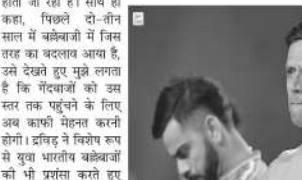
उन्होंने कहा, अगर सुंतुलन की बात करें तो इस फिलहाल बल्लेबाज, गेंदबाजों का तुलना में टी20 क्रिकेट की मांग के हिसाब से ज्यादा बेहतर तरीके से रहते हैं।

है, जिससे गेंदबाजों को परेशानी में डाल दिया है। साथ ही कहा कि आज के इस दौर में गेंदबाजों की भी विविधता लानी होगी। उन्होंने कहा, अगर सुंतुलन की बात करें तो इस फिलहाल बल्लेबाज, गेंदबाजों का तुलना में टी20 क्रिकेट की मांग के हिसाब से ज्यादा बेहतर तरीके से रहते हैं। हालांकि, द्रविड़ को उम्मीद है कि अभी वाले समय में गेंदबाज इतना सामना बेहतर तरीके कर सकेंगे। द्रविड़ ने इस बात पर भी जोर दिया कि साराट पिंपरी पर गेंदबाजों के लिए लगातार सफल होना