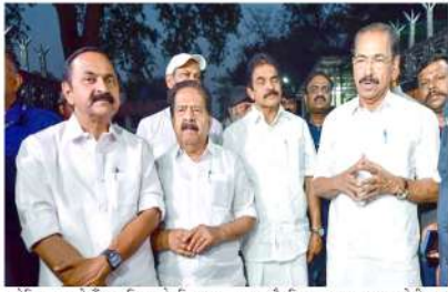
कोशिश कर रहे हैं, जबकि उनके खिलाफ व्यापक जनभावना मौजूद है। उनमें से एक पोटरर चेतवानी देता है कि केरल आपको कभी माफ नहीं करेगा, जबकि दूसरा पोटरर एक अशुभ घोषणा करता है कि बायनाड दूसरा अमेठी बन जाएगा। यह सीधे तौर पर उस शर्मनाक चुनावों हार को याद दिलाता है जो इन्होंने 2019 में उत्तर प्रदेश में झेलनी पड़ी थी। बायनाड, जो कभी राहुल गांधी