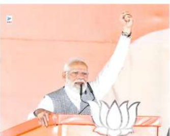
हूए उन्होंने कहा कि शांति और सामंजस्य एक-दूसरे के पूरक होते हैं। केवल क्षमता होना पर्याप्त नहीं, उसे कार्यक्षम देने वाली शक्ति भी आवश्यक है, और शक्ति भी तभी सार्थक होती है जब उसके पीछे समर्थ आधार हो। जैसे निरव और शांति का अस्तित्व परस्पर अविभाज्य माना गया है, वैसे ही सामंजस्य और ऊर्जा के समन्वय ही सृजन, प्रगति और सफलता संभव होती है। गौरवस्थ है कि 13 मई 1998 का दिन भी भारत के इतिहास में अत्यंत महत्वपूर्ण है। इसी दिन राजस्थान के पोखरण में अंतरराष्ट्रीय पहचान मिली, जिसने देश की सुरक्षा और संप्रभुता को और मजबूत किया।

नई दिल्ली। प्रधानमंत्री नरेंद्र मोदी ने बुधवार को सोशल मीडिया प्लेटफॉर्मों पर पोस्ट करते हुए 1998 में हुए पोखरण परमाणु परीक्षणों को याद किया। उन्होंने कहा कि इन परीक्षणों ने दुनिया को भारत की अटल इच्छाशक्ति से अवगत कराया और यह साबित किया कि दबाव के बावजूद भारत अपनी संप्रभुता से कोई समझौता नहीं करता।