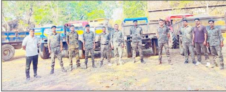
कार्यवाही लगातार जारी रखी जा रही।

जिले में रेत के अवैध उत्खनन और उसकी अवैध बिक्री का कार्य थड़ले से किया जा रहा है, इसके खिलाफ पुलिस भी समय-समय पर कार्यवाही कर रही है, बावजूद इसके भी रेत के अवैध उत्खनन और उसकी अवैध बिक्री पर पूर्णतः प्रतिबंध नहीं लग पाया है, रेत के अवैध उत्खनन, उसकी बिक्री से जुड़ा ताजा मामला खिवाह 10 मई की सुबह का है। जहाँ थाना हट्टा के ग्राम मंगोली खुर्द वैनागा नदी घाट में छापामार कार्यवाही कर हटा पुलिस ने रेत से भरे 5 ट्रैक्टर ट्राली को जप्त किया है वही इस अवैध काम में शामिल 4 आरोपियों को अभिरक्षा में लेकर पूछताछ शुरु कर दी है।