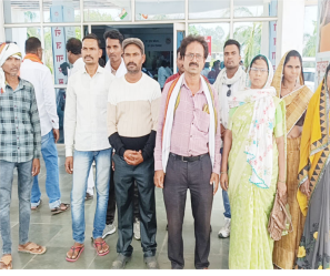
यदि जल्द ही मांग पूरी नहीं हुई, तो वे आगे आंदोलन करने के लिए बाध्य होंगे।

रहने और कार्यों में लापरवाही बरतने के गंभीर आरोप लगाए हैं। पंचायत प्रतिनिधियों का कहना है कि रोजगार सहायक की अनुपस्थिति के कारण शासन की विभिन्न योजनाओं का क्रियान्वयन प्रभावित हो रहा है और ग्रामों में को इसका सीधा नुकसान उठाना पड़ रहा है। सरपंच ने बताया कि जिला प्रशासन को रोजगार सहायक को अनुपस्थिति से मरगोरा सहित आने शासकीय योजनाओं का संचालन प्रभावित हो रहा है। मजदूरों की समय पर काम नहीं मिल पा रहा है और भुगतान में भी देरी हो रही है। इससे ग्रामों में असंतोष की स्थिति बन रही है। पंचायत प्रतिनिधियों ने शासन से मांग की है कि मामले को गंभीरता से लेते हुए तत्काल कार्रवाई की जाए और अनुपस्थित रोजगार सहायक को हटाकर उसके स्थान पर नया कर्मचारी नियुक्त किया जाए, ताकि पंचायत का कार्य सुचारू रूप से संचालित हो सके। उन्होंने चेतावनी दी है कि यदि तत्काल समाधान नहीं हुआ तो वे आंदोलन का रास्ता अपनाने को मजबूर होंगे। वहीं ग्रामों में भी कलना है कि पंचायत स्तर पर कार्यों में पारदर्शिता और निष्पत्ति बनाए रखना बेहतर जरूरी है। ऐसे में यदि जिम्मेदार कर्मचारी ही अपने कर्तव्यों से अनुपस्थित रहेगा, तो विकास कार्यों पर असर पड़ना स्वाभाविक है। अब देखना होगा कि प्रशासन इस मामले में कब तक ठोस कदम उठाता है।