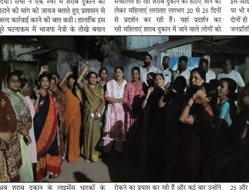
अब शराब दुकान को लाइसेंस धारकों के लिए एक खुली चुनौती के रूप में देखे जा रहे हैं। शहर में शराब दुकान को हटाने जाने और उनके स्थान परिवर्तन को लेकर बौते कुछ दिनों से अलग-अलग वार्डों में प्रदर्शन हो रहा था, जिसमें कुछ वार्डों में वार्ड की महिलाओं को सफलता भी मिली है। वहीं वार्ड क्रमांक 12 बूढ़ी में चर्चा से