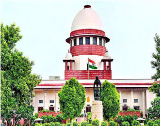
व्यापक प्रतिक्रिया दी जाएगी। मामले पर कोर्ट ने स्वयं संज्ञान लिया था। इस फेसले से प्रशिक्षण के दौरान पाठ्य या दिव्यांग हुए सैन्य कैंडिडेट को बड़ा लाभ मिल सकता है। यदि उन्हें पूर्व सैनिक का दर्जा मिलता है, तो नौकरियों में आश्रण का फायदा मिलेगा, जिससे उनके लिए रोजगार के अवसर बढ़ेंगे। रक्षा सेवासों से जुड़े डेढ़क जॉब या पुनर्वास के अवसर भी मिल सकते हैं।