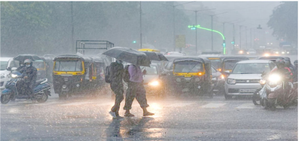
से सफ़िर पश्चिमी विक्षोभ का असर साफ दिख रहा है। शुकुवार को हल्की बूंदबांदी के बाद दिनभर बादल छाए रहे, जसुरस गमी से रहल मिली। विभाग के अनुसार 7 अप्रैल तक मौसम में उतार-चढ़ाव बना रहेगा। हालांकि, बदला हुआ मौसम किसानों के लिए चिंता बढ़ा रहा है। लगातार नमी और बारिश के कारण गेहूँ को फसल प्रभावित हो रही है।

प्रदेश के बीच से एक टर्फ गुजर रही है, जबकि ऊपरी हिस्से में दूसरी टर्फ सिरसम है। वहीं पश्चिमी और उत्तरी हिस्सों में दो चक्रवाती सिरसम भी बने हुए हैं। शनिवार को ग्वालियर में शाम करीब 4 बजे अचानक मौसम बदला और तेज बारिश के साथ ओले गिरे। मौसम विभाग ने पहले ही तेज बारिश, आंधी और ओले गिरने की चेतावनी जारी की थी। शहर में जम्मू-कश्मीर