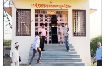
दी है, लेकिन आरोपी अभी भी पुलिस की पकड़ से बाहर हैं।

पद्मेश न्यूज | बालाघाट | जिले में चोरों के हाँसेले बूढ़ते होते जा रहे हैं चोरों ने नगर समीप स्थित दो मंदिरों पर धावा बोल दिया। दोनों मंदिरों से लाखों के चांदी के मुकुट और नगदी पर हथ साफ कर दिया गया। पहली वारदात ग्रामीण थाना नवगांव अंतर्गत प्रायत नगर के साई मंदिर में हुई, जबकि दूसरी घटना कोतवाली थाना क्षेत्र के ग्राम गायखुरी स्थित वैनागा नदी बेट के सहस्त्रबाहु मंदिर में अंदाज दो। पुलिस ने दोनों मामलों में जांच शुरू कर