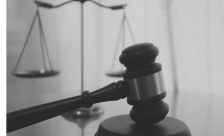
सोसाइटी के रिपयर और मेंटेनेंस के फंड को लेकर शुरु हुई बातचीत लंबी कानूनी जंग में बदल गई। उस समय सोसायटी की बैठक के निमंत्रण में महिला को प्रेजिडेंटशिप ऑफ द रिपयर्स दिया गया था। इस बात से महिला को इतनी डर पहुंची कि उन्होंने हाईकोर्ट के सदस्यों के खिलाफ मामलाना का मुकदमा दायर किया।

-सोसाइटी मेंटेनेंस के फंड को लेकर शुरु हुई बातचीत कानूनी जंग में बदली मुंबई। बॉम्बे हाईकोर्ट में एक अनोखा और हैरान कर देने वाला मामला सामने आया। मुंबई की एक सोसायटी में रहने वाली 90 साल की बुजुर्ग महिला को सोसायटी के सदस्यों पर इनाम गुस्ता आया कि उन्होंने बॉम्बे हाईकोर्ट में मामलाना का मामला दायर कर दिया। इतना ही नहीं बहुत समझने और सदस्यों के माफ़ी मांगने के बाद भी वे नहीं माने और केस लड़ने पर अड़ी रहीं। आखिरकार थककर हाईकोर्ट ने बुजुर्ग महिला को 20 साल अग्राम करने की सलाह दी और कहा कि उनका केस साल 2046 के बाद सुना जाएगा। बता दें भाजपा मुंबई की एक सोसायटी का है। यहां अपनी बेटों के साथ रह रही 90 साल की बुजुर्ग महिला ने अपने सोसायटी के पुराने मेंमेंटिंग कमिटी के सदस्यों पर 20 करोड़ रुपए का मामलाना का मुकदमा दायर किया है। यह मामला करीब 10 साल पुराना है। जब मुंबई। बॉम्बे हाईकोर्ट में एक अनोखा और हैरान कर देने वाला मामला सामने आया। मुंबई की एक सोसायटी में रहने वाली 90 साल की बुजुर्ग महिला को सोसायटी के सदस्यों पर इनाम गुस्ता आया कि उन्होंने बॉम्बे हाईकोर्ट में मामलाना का मामला दायर कर दिया। इतना ही नहीं बहुत समझने और सदस्यों के माफ़ी मांगने के बाद भी वे नहीं माने और केस लड़ने पर अड़ी रहीं। आखिरकार थककर हाईकोर्ट ने बुजुर्ग महिला को 20 साल अग्राम करने की सलाह दी और कहा कि उनका केस साल 2046 के बाद सुना जाएगा। बता दें भाजपा मुंबई की एक सोसायटी का है। यहां अपनी बेटों के साथ रह रही 90 साल की बुजुर्ग महिला ने अपने सोसायटी के पुराने मेंमेंटिंग कमिटी के सदस्यों पर 20 करोड़ रुपए का मामलाना का मुकदमा दायर किया है। यह मामला करीब 10 साल पुराना है। जब