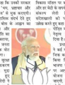
प्रधानमंत्री मोदी ने कहा कि टीएमसी को बुझा दिया जा रहा है।

दार्जिल। प्रधानमंत्री मोदी ने शुक्रवार को प्रथम बंगाल के दमदम में आयोजित जनसभा में समाजवादी गुणमूल कांग्रेस (टीएमसी) और विपक्ष पर जोरदार हमला बोला। दूसरे चरण के मतदान से पहले उन्होंने कहा कि 'टीएमसी का दीया अब बुझने वाला है'। और राज्य में बदलाव को सही तरह दिखाने दे रही हैं। प्रधानमंत्री मोदी ने दावा किया कि पहले चरण के मतदान में भाजपा के पक्ष में माहौल बना दिया है और यह 'विजय का संकेत' है। उन्होंने आरोप लगाया कि टीएमसी ने लोकतंत्र को कमजोर किया है, जबकि जनता अब उसे फिर से स्थापित करने के लिए आगे आ रही है। उन्होंने कहा कि 'हूँ बुझना हुआ दीपक अंत में फड़फड़ाता है, वैसे ही टीएमसी भी बुझने लगी है'। पीएम मोदी ने जनता से भाजपा को समर्थन देने की अपील करते हुए कहा कि उनकी सरकार को 'धय, धयागार और सिंडिकेट राब' से मुक्त कराएगी। उन्होंने ऐतिहासिक संदर्भ देते हुए सुभाष चंद्र बोस के आह्वान का जिक्र किया और इसे 'नई क्रांति का समय' बताया, जिसमें जनता का एक-एक वोट निर्णायक होगा।