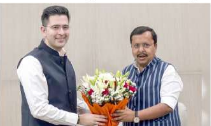
राघव चड्ढा ने प्रेस कॉन्फ्रेंस में कहा कि आप के 10 राज्यसभा सांसदों में से दो-तिहाई यानी सात सांसदों ने भाजपा में शामिल होने का फैसला किया है। उनके साथ राघव चड्ढा, संदीप पाठक, अशोक मिश्रल, रावेन्द्र गुप्ता और विक्रमजीत साहनी भी भाजपा में शामिल होंगे।

नई दिल्ली। आम आदमी पार्टी (आप) के भीतर चल रहा सियासी संघटन अब बड़े राजनीतिक भूचाल में बदल गया है। पार्टी के राज्यसभा सांसद राघव चड्ढा ने शुक्रवार को इन्फोफा देते हुए भाजपा में शामिल होने का ऐलान कर दिया। उनके साथ संदीप पाठक, अशोक मिश्रल समेत कुल सात राज्यसभा सांसदों ने पार्टी छोड़ने का निर्णय लिया है।