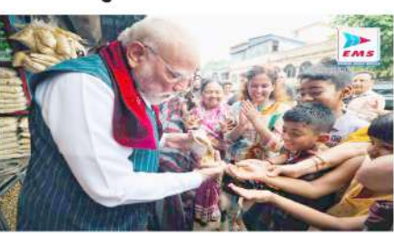
पीएम ने ममता सरकार को बताया निर्मम

नई दिल्ली/कोलकाता/चेन्नई। लोकसभा में महिला आरक्षण विधेयक से जुड़ा संसोधन पास नहीं हो पाया। इसके बाद देश में राजनीति महील गरमा गया है। जहां देशभर में भाजपा और विपक्ष एक-दूसरे पर हमलवार हैं, वहीं पंजाब और तमिलनाडु के चुनावी मैदान में महिला आरक्षण को मुद्दा खड़ा हुआ है। प्रथममंत्री नरेंद्र मोदी स्पष्ट रूप से भाजपा विधेयक को महिला विरोधी बताते हुए महिलाओं को आकर्षित करने में जुड़े हुए हैं। दरअसल, पूर्व के चुनावों में भाजपा ने जिस तरह गैर-नियत बनावट नीत खसिल किया है, उसी तरह पर पंजाब और तमिलनाडु में महिला आरक्षण को धुपाने की कोशिश की जा रही है। रिविजर को प्रथममंत्री नरेंद्र मोदी ने बंगाल में अपनी हर सभा में मजबूत बनाई और विपक्ष पर हमला किया। वहीं तमिलनाडु में गुजरात में भी अमित शाह ने डीएफके पर जोरदार हमला किया।