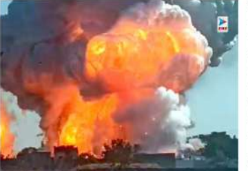
को संख्या बढ़ सकती है।

चेन्नई। तमिलनाडु के विरुधुनगर जिला में स्थित एक पटाखा निर्माण इलाके में भीषण विस्फोट होने की घटना सामने आई है। इस दुर्घटना में अब तक 16 लोगों की मौत हो चुकी है, जबकि 6 लोग गंभीर घायल हो चुके हैं। राहत कार्य अचल चल रहे हैं और बचाव में काम चल रहा है। फरवरी में 30 लोगों के मौजूद होने की बात कही जा रही है, इससे मृतकों की संख्या बढ़ने की आशंका की जा रही है। हादसे के बाद पूरे इलाके में अफरा-तफरी का माहौल है और राहत एवं बचाव कार्य तेजी से जारी है।