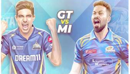
खेल पाएंगे। ऐसे में टीम की मुश्किलें बढ़ गयी हैं। टीम के पास सुर्यकुमार याद जैसे बल्लेबाज और जसप्रीत बुमराह जैसे गेंदबाज हैं पर इसके बाद भी उसका अलग तब का प्रदर्शन बेहतर खराब रहा है। अपने पिछले पांच मैचों में से चार हारी है। वह

अहमदाबाद। गुजरात टाइटन्स की टीम सोमवार को यहाँ अपने जूट मैदान पर मुंबई इंडियन्स के खिलाफ जीत के इरादे से उतरेगी। शुभमन गिल की कप्तानी में उतर रही गुजरात ने दूरकालीन इतिहास से वापसी करते हुए पिछले तीन मैचों में शानदार जीत हासिल की है। जिससे उसके हिसाबे बुलंद है। टीम के पास बल्लेबाजी में कप्तान शुभमन गिल के अलावा साई सुदर्न और जोस बटलर जैसे बल्लेबाज जबकि गेंदबाजी में प्रसिद्ध कुम्हार के अलावा राशिद खान जैसे गेंदबाज हैं। दूसरी ओर हादिक पांडेया की कप्तानी में मुंबई इंडियन्स को टीम का प्रदर्शन इस सत्र में अच्छा नहीं रहा है। उसे लगातार हार का सामना करना पड़ा है। जिससे टीम दबब में है और वह किसी भी हाल में इस मैच में जीत चाहेंगी। टीम की बल्लेबाजी में निरंतरता की कमी है जिसे उसे दूर करना होगा। अनुभवी बल्लेबाज रोहित शर्मा चोटिल होने के कारण ये मैच नहीं