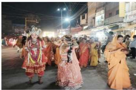
यात्रा का समापन कर प्रसाद वितरण भंडारा सहित विभिन्न कार्यक्रमों संग कराए गए जो देर रात तक चलते रहे।

पद्मेश न्यून। बालाघाट। रविवार को जिला मुख्यालय सहित अन्य तहसील व ग्रामीण अंचलों में प्रति वर्ष की तरह इस वर्ष भी अक्षय तृतीया पूर्व पर भगवान परशुराम जयंती हर्षोल्लास के साथ मनाई गई जिसके तहत जगह-जगह विभिन्न कार्यक्रमों के आयोजन किए गए। इसी के तौर पर सर्व ब्राम्हण समाज बालाघाट द्वारा नगर के जय स्तंभ चौक स्थित माता त्रिपुरा मंदिर में भगवान परशुराम जी की सामूहिक आरती पर जयंती मनाई गई। भगवान परशुराम जी के जन्मोत्सव पर हवन, पूजन, मठा आरती, प्रसाद वितरण और भंडारे का आयोजन किया गया। तो वहीं सामाजिक बंधुओं ने भगवान परशुराम की शान में गगन चुंबी नई लगते हुए अन्नका उपकरण किया। इस पूजन सर्व ब्राम्हण समाज द्वारा भगवान परशुराम जयंती के अवसर पर गांधीवा रोड स्थित नव श्रीराम मंदिर में रविवार सुबह करीब 9 बजे से भगवान परशुराम जी की विशेष पूजा, अर्चना, पूजन, कर प्रसाद का वितरण किया। वहीं सामूहिक आरती, प्रसाद वितरण सहित विभिन्न कार्यक्रम समस्त कराए गए। इसके उपरान्त शाम करीब 07 बजे नव श्रीराम मंदिर से ही भगवान परशुराम की भव्य शोभायात्रा निकाली गई जो विभिन्न मंडीों का गन्त करे हुए, वापस मंदिर पहुंची। जहाँ शोभा