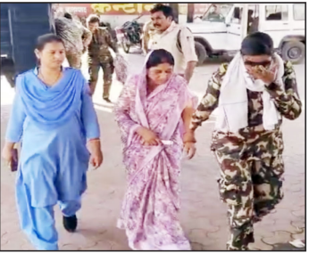
सिटी रिपोर्टर। पद्मेश न्यूज़। बालाघाट।