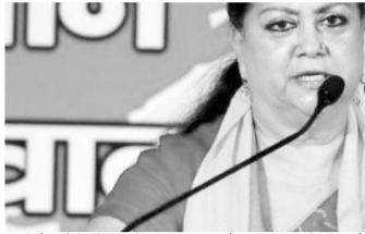
मिलने के दर्द से जोड़कर देखा। हर बार रीएम तो नहीं बना जा सकता- राठौड़

नई दिल्ली। राजस्थान की राजनीति में पूर्व मुख्यमंत्री वसुंधरा राजे के एक बयान ने हलचल मचा दी है। मनोहर थामा में आयोजित जनसभा के दौरान उनके सब कुछ खो दिया वाले भावुक बयान के बाद सिवासी बयानवाजी तेज हो गई है और मामला अब पक्ष-विपक्ष के बीच टकराव का कारण बन गया है।