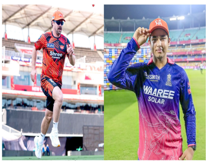
12 जबकि रॉयल्स ने 9 जीते हैं। गौरतलब है कि इन दोनों ही टीमों के बीच आखिरी आईपीएल मुकाबला पिछले सीजन हैदराबाद के मैदान पर ही खेला गया था जिसे मेजबान टीम ने 286 रन का स्कोर डिक्रेंड करके राजस्थान रॉयल्स से 44 रनों से जीता।

हैदराबाद। आईपीएल 2026 में सोमवार को राजस्थान हैदराबाद का मुकाबला राजस्थान रॉयल्स से होगा। इस में राजस्थान का लक्ष्य अपनी जीत के सिलसिले को बनाये रखना रहेगा। राजस्थान को टीम में युवा रिजल फरम को कप्तानी में अपने अब तक के सभी चारों मैच जीते हैं जिससे उसके होसले बलुल हैं। वहीं दूसरी ओर, सनराइजर्स हैदराबाद का प्रदर्शन अब तक मिला-जुला रहा है। सनराइजर्स को कमजोरी इस बार भी गेंदबाजी रही है। यहां को निच बल्लेबाजों के अनुरूप है और ऐसे में अगर सनराइजर्स को टीम टॉस जीती है तो उसका लक्ष्य पहले बल्लेबाजी करते हुए बड़ा स्कोर बनाना रहेगा। इस सत्र में अब तक राजस्थान हावी रही है। ऐसे में इस मैच में भी उसका पलड़ा भारी है। आंकड़ों पर नजर डालें तो दोनों के बीच अब तक 21 मुकाबले हुए हैं जिसमें से सनराइजर्स से