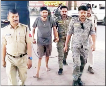
सिटी रिपोर्टर। पद्मेश न्यूज़। बालाघाट।