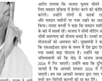
तृणमूल कांग्रेस (टीएमसी) प्रमुख ने आरोप

नई दिल्ली। अल्पसंख्यक नेतृत्व के एकीकरण को लेकर कांग्रेस में तनाव बढ़ गया है। कहा जा रहा है कि पार्टी हाइकमान सीएम सिद्धारमैया के करीबी नेताओं पर पार्टी विरोधी विधेयकों से नाराज हैं। ऐसे में नए नेताओं पर पार्टी आलाकमान द्वारा एक्शन ले सकता है। हाल ही में अल्पसंख्यक कल्याण को लेकर पंजाब सरकार ने इस विधेयक को लेकर कहा कि बीबी वक में श्री गुरु ग्रंथ साहिब और अन्य पवित्रता को भंगवाने वाला संस्कार करने वालों से जुड़े एक विधेयक को मंजूरी दी है। पंजाब की भाजपा मान सरकार ने गुरु ग्रंथ साहिब का अपमान करने वालों से जुड़े एक विधेयक को मंजूरी दी है। पंजाब सरकार ने एन 'बेअदबी' कानूनों को रोकने और गुरु ग्रंथ साहिब की पवित्रता को बनाए रखने के लिए किया है। मुख्यमंत्री भगवत सिंह मान की अध्यक्षता में हुई सत्र के मंत्रिमंडल की बैठक में साजग जोत श्री गुरु ग्रंथ साहिब संस्कार (संशोधन) विधेयक, 2026 को मंजूरी दी गई। इस कानून में 'बेअदबी' की घटना पर 5 लाख रुपये से लेकर 25 लाख रुपये तक के जुर्माने की भी प्रत्याशा है।