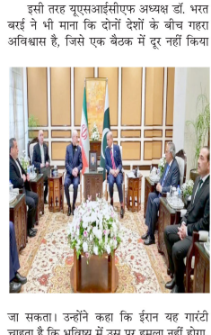
जा सकता। उन्होंने कहा कि ईरान यह गर्दटी चाहता है कि भविष्य में उस पर हमला नहीं होगा।

नई दिल्ली। इस्लामाबाद में हुई अमेरिका और ईरान के बीच शांति वार्ता बिना किसी ठोस तंत्री के समाप्त हो गई। वार्ता विफल होने के बाद अंतरराष्ट्रीय मामलों के विशेषज्ञों ने माना कि दशकों पुरानी दुश्मनी को कुछ घंटों की बातचीत में सुलझाना संभव नहीं है। विशेषज्ञों का कहना है कि दोनों देशों के बीच तंत्रे समय से चला आ रहा है, अविश्वास और पलाताई मतभेद इस बातचीत को सबसे बड़ी बाधा रहे। कई विशेषज्ञों ने इसे 'जलजल और गहरी देर वाली समस्या' बताते हुए कहा कि ऐसे विवादों का समाधान तंत्रे संभव नहीं होता। एक वैश्विक चर्चा के दौरान (R) स्पष्ट फैसला देने के, पांडेय ने कहा कि बातचीत से बहुत बड़ी उम्मीदें पहले से ही नहीं थीं, लेकिन विश्व भी कुछ सकारात्मक संकेत सामने आए हैं। उन्होंने कहा कि दशकों से चले आ रहे विवाद का समाधान 21 घंटों में निकलाना अवास्तविक अपेक्षा थी। उन्होंने यह भी कहा कि अगर प्रमुख मुद्दों पर सहमति बनती तो भारत पर दबाव बनाने की स्थिति पैदा हो सकती थी।