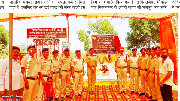
विवो V23 Pro