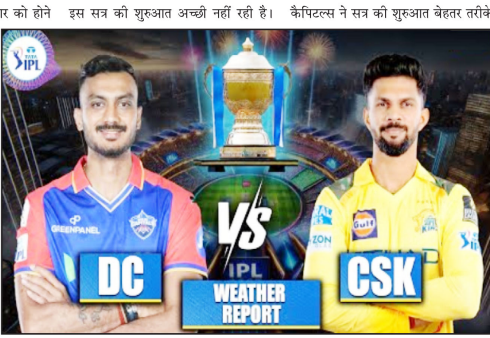
टीम अपने शुरूआती मैच में आरसीबी और पंजाब किंग्स से हारी है। टीम की बल्लेबाजी ही नहीं गेंदबाजी भी कमजोर रही है। वहीं

वहीं लखनऊ सुपर जायंट्स के प्रिय यादव को लाम हुआ है। ऑरेंज कैप की सूची में राखेश्यान रिवस के सहयोगी बल्लेबाज यशवीर जासवाल पहले स्थान पर हैं। उन्होंने अभी तक खेलते 3 मुकाबलों में 163.46 के स्ट्रोक रेट के साथ 170 रन बनाये हैं। वहीं दिल्ली कैपिटल्स के समीर रिशवी और केकेआर के अंगकृश रघुवंशी दूसरे और तीसरे नंबर पर हैं। शीर्ष पांच बल्लेबाजों में सनराइजर्स हैदराबाद के विकेट्स करनसेन और केकेआर के अजिंक्य रहाणे चौथे और पांचवें नंबर पर हैं। पर्पल कैप की सूची में राखेश्यान रिवस के स्टाइमिन्स और विनियॉन्स नंबर एक पर बने हुए हैं। उन्होंने इस सीमा में अपनी तक तीन मैचों में 7 विकेट दर्ज की हैं। वहीं गुजरात टाइटंस के प्रसिद्ध कृष्णा और राशिद खान के साथ-साथ दिल्ली कैपिटल्स के लुना पैतगिरी और राखेश्यान रिवस के लुना पैतगिरी-5 में शामिल हैं। लखनऊ सुपर जायंट्स के प्रिय यादव 5 विकेट के साथ 7वें नंबर पर पहुंच गए हैं। वहीं केकेआर के वैभव अरोड़ा अवे पायदान पर हैं।