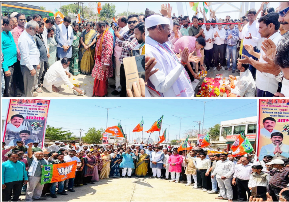
दूसरे पक्ष ने ऊपर से अपने पोस्टर लगा दिए जिससे मौजूदगी की जड़, रात में हुआ पोस्टर वॉर

ब्रिज के गार्ड पर ही धरने पर बैठे विधायक आगे जाने से और रोकें जाने से साराज