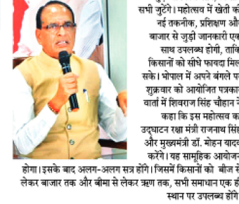
डॉ। इसके बाद अलग-अलग सत्र होंगे। पत्रकारों को बीज से लेकर बाजार तक और बीबी से लेकर त्रण तक, सभी समाधान एक ही स्थान पर उपलब्ध होंगे।

भोपाल। राजसेन में शनिवार से शुरू होने वाले उन्नत कृषि महोत्सव को लेकर कृषि मंत्री शिवराज सिंह चौहान ने दावा किया है कि महोत्सव में किसानों को बीज से लेकर बाजार तक समग्र समाधान मिल सकेंगे। यहां पर देशभर के कृषि विशेषज्ञ और कृषि संस्थाओं से जुड़े जानकारों लोग, किसान सभी जुटेंगे। महोत्सव में खेती की नई तकनीक, प्रशिक्षण और बाजार से जुड़ी जानकारी एक साथ उपलब्ध होगी, ताकि किसानों को बीज से लेकर बाजार तक समग्र समाधान मिल सकें। भोपाल में अपने बंतेल पर शुक्रवार को आयोजित पत्रकार वार्ता में शिवराज सिंह चौहान ने कहा कि इस महोत्सव का उद्घाटन रक्षा मंत्री राजनाथ सिंह और मुख्यमंत्री डॉ. मोहन यादव करेंगे। यह सामूहिक आयोजन होगा।