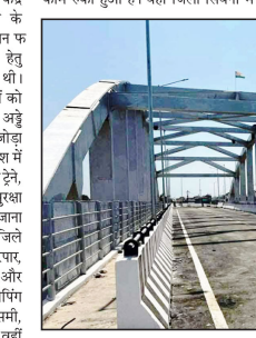
रेलवे के सिक्नी नागपुर रोड पर स्थित रोड

का रकम हुआ है। वहीं जिला सिक्नी में भी ओवर ब्रिज का निर्माण कार्य शुरू है। भारतीय