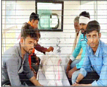
पद्मेश न्यूज। वारासिवनी।

21 वर्षीय युवक की दर्दनाक मौत परिजनों ने लगाया लापरवाही का आरोप