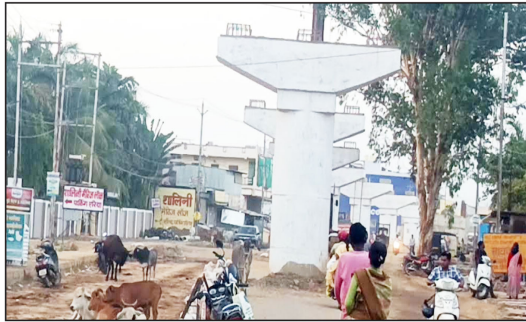
कैसे ग्रामीण के हो गए।

भटेरा रेलवे ओवर ब्रिज निर्माण को लेकर नए नए अड़ंगे सामने आ रहे हैं। जहां पहले तो स्थानीय लोगों में ओवरब्रिज निर्माण को लेकर किए गए नापजोख में काफी नाराजगी देखी गई। तो अब भू अर्जन को लेकर दिए जा रहे मुआवजे को लेकर भी लोग नाराज हैं। स्थानीय लोगों का आरोप है कि नगर के वार्ड नंबर 10 को शहरी क्षेत्र बात कर शहरी क्षेत्र के हिसाब से मुआवजे का निर्धारण किया गया है, तो वहीं वार्ड नंबर 11 को ग्रामीण क्षेत्र बताकर ग्रामीण क्षेत्र के हिसाब से मुआवजे का निर्धारण किया जा रहा है। वहीं दोनों वार्डवासियों को नियम के हिसाब से मुआवजा ना देकर काफी कम राशि का मुआवजा दिया जा रहा है। जबकि दोनों ही वार्ड नागरपालिका के अंतर्गत शहरी क्षेत्र के वार्ड हैं। खासकर इसके भी मुआवजा वितरण पणाली में अलग-अलग मुआवजे का निर्धारण किया गया है, तो वहीं वार्ड नंबर 11 को ग्रामीण क्षेत्र बताकर ग्रामीण क्षेत्र के हिसाब से मुआवजे का निर्धारण किया जा रहा है। वहीं दोनों वार्डवासियों को नियम के हिसाब से मुआवजा ना देकर काफी कम राशि का मुआवजा दिया जा रहा है। जबकि दोनों ही वार्ड नागरपालिका के अंतर्गत शहरी क्षेत्र के वार्ड हैं। खासकर इसके भी मुआवजा वितरण पणाली में अलग-अलग मुआवजे का निर्धारण किया गया है, तो वहीं वार्ड नंबर 11 को ग्रामीण क्षेत्र बताकर ग्रामीण क्षेत्र के हिसाब से मुआवजे का निर्धारण किया जा रहा है। वहीं दोनों वार्डवासियों को नियम के हिसाब से मुआवजा ना देकर काफी कम राशि का मुआवजा दिया जा रहा है।