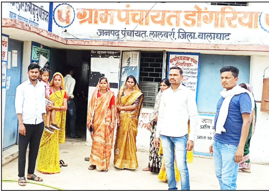
सही पाई गई। जिस पर अधिकारियों द्वारा रोजगार सहायक व वैधानिक कार्यवाही किए जाने का भरोसा दिखाया गया है।

पद्मेश न्यूज। बालाघाट। विस्तरीय पंचायत राज के तीसरे क्रम वाली ग्राम पंचायतों में सरकारी योजनाओं को सुचारु रूप से लागू करने और सरपंच व सचिव को सहायता के लिए सरकर ने पंचायतों में रोजगार सहायकों की नियुक्ति की है। जिससे ग्रामीणजनता को भी काफी मदद मिल रही है। किंतु जिला मुख्यालय के समीप व लालबारी जनपद पंचायत अंतर्गत आने वाली ग्राम पंचायत डोंगरिया एक ऐसी पंचायत है जहां 4-5 माहों से रोजगार सहायक पंचायत ही नहीं आ रहे हैं। जहां रोजगार सहायक ना होने से पंचायत के काम काफी हद तक प्रभावित हो चुके हैं। इन्हें लोगों को मनरेगा योजना के तहत किए गए कार्य का भुगतान नहीं हो पा रहा है, तो वहीं आवुष्मान कार्ड, संबल कार्ड, केवाईसी सहित अन्य कार्य भी पूर्ण रूप से प्रभाव प्रभावित हो चुके हैं। जिस पर अपनी नाराजगी जताते हुए पंचायत पदाधिकारियों द्वारा मामले को शिकायत जनपद व जिला पंचायत के अधिकारियों से की गई थी। वहीं बार-बार की गई शिकायत के बावजूद भी रोजगार सहायक पंचायत वापस नहीं आया। जिसपर अपनी नाराजगी जताते हुए अब पंचायत बांडी ने, पंचायत नहीं आने वाले रोजगार सहायक का उनको पंचायत से तलकत स्थानांतरण किए जाने की मांग की है। जहां उन्होंने जल्द से जल्द मांग पूरी हो जाने पर, सरपंच, उप सरपंच सहित सभी 16 पंचों के साथ सामूहिक रूप से इस्तीफा सौंपने की चेतावनी दी है।