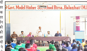
Govt. Model Higher Secondary School Birsar, Balaghat (M.P.)