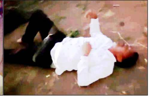
पद्मेश न्यूज। वारासिवनी।