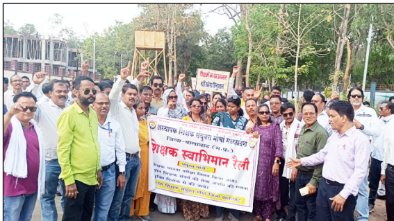
सिटी रिपोर्टर। पद्मेश न्यूज़। बालाघाट।