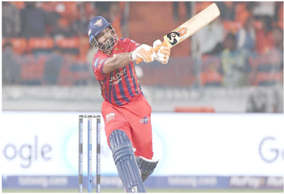
करके केकेआर पर 4 रनों से जीत दर्ज की। सुपर जायंट्स ने ऐसे में इस मैच में भी सुपर जायंट्स का पिछले मैच में जीत दर्ज की थी जिससे

कोलकाता। कोलकाता नाइटराइडर्स (केकेआर) टीम गुरुवार को यहां के ईडन गार्डन में होने वाले आईपीएल मुकाबले में लखनऊ सुपरजायंट्स का सामना करेगी। केकेआर का लक्ष्य इस मैच में चरलू मैदान का लाभ उठाकर सत्र में पहली जीत करना होगा। इस सत्र में अब तक हुए तीनों ही मैचों में केकेआर हारी है। इससे वह काफी दबाव में है। टीम की बल्लेबाजी और गेंदबाजी अब तक असफल रही है। अभी तक केकेआर ने चार इनवॉल्ट्स को दो मैचों के बीच 6 मैच हुए हैं जिसमें से 2 केकेआर जबकि 4 सुपर जायंट्स ने जीते हैं। इन दोनों ही टीमों के बीच आखिरी मुकाबला पिछले आईपीएल सत्र में कोलकाता के ईडन गार्डन स्टेडियम में ही खेला गया था जहां लखनऊ सुपर जायंट्स की टीम ने 238 रनों का स्कोर