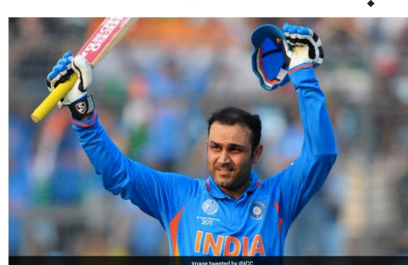
चाहिये। उन्होंने साथ ही कहा, अगर कोई स्ट्राइक रेट या बल्लेबाजी शैली पर सवाल उठता है, तो उसमें परेशानी होने की जरूरत नहीं है। आपको इसकी जाह पर अपने खेल पर ध्यान देना चाहिए।सहवाग ने महान बल्लेबाज सचिन तेंदुलकर का जिक्र करते हुए

नई दिल्ली। पूर्व सलामी बल्लेबाज वीरेंद्र सहवाग ने आईपीएल में कोलकाता नाइटराइडर्स की कप्तानी कर रहे आर्जुन राहु को हौसला बढ़ाते हुए कहा है कि वह स्ट्राइक रेट को लेकर जारी बहस में नहीं पड़ेंगे हुए अपने प्रदर्शन पर ध्यान दें। आईपीएल में रहाणे अपने कम स्ट्राइक रेट के कारण आलोचकों के निशाने पर रहे हैं। इसी को देखते हुए सहवाग ने उन्हें अहम सलाह दी है। सहवाग ने कहा कि रहाणे को प्रशंसा पर न ज्यादा ध्यान देना चाहिए और न ही आलोचना पर निराश होने की। सहवाग ने कहा, मुझे नहीं लगता कि खिलाड़ियों को इस तरह की बातों पर अधिक ध्यान देना चाहिए क्योंकि लोग आलोचकों की कमी और आलोचना भी पर आपको दोनों को ही समान रूप से लेना