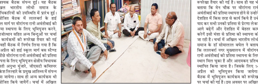
डिवाइडर पर स्थित रिक्त भूमि के कोने (कॉर्नर) पर प्रतिमा स्थापना करना चाहते आश्रवस्त किया गया है। समाज के द्वारा आगामी 14 अप्रैल को वीरंगना रानी

पद्मेश न्यूज। लालबर्बा। ज्ञानपौषकर मुख्य मार्ग चयन स्टैंड से हाई स्कूल को और जाने वाली सड़क के करने की मांग की गई थी और उन्होंने हमें