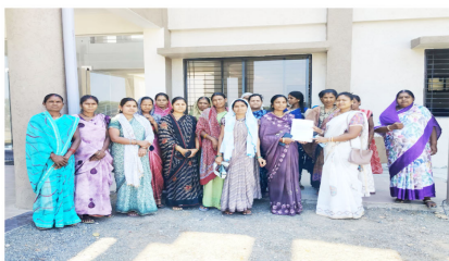
बालो के खिलाफ नामजद शिकायत करते हुए उनके विरुद्ध वैधानिक कार्यवाही किए जाने की गुहार लगाई है।

पद्मेश न्यूज। बालाघाट। प्रदेश शासन के निर्देशानुसार जिले में अवैध शराब निर्यात और उसकी बिक्री रोकने के लिए निम्नोदारी द्वारा बड़ी संख्या में रोजाना ही कार्यवाही की जा रही है। निम्नोदारी द्वारा बड़ी संख्या में रोजाना ही कार्यवाही की जा रही है। निम्नोदारी द्वारा बड़ी संख्या में रोजाना ही कार्यवाही की जा रही है। निम्नोदारी द्वारा बड़ी संख्या में रोजाना ही कार्यवाही की जा रही है।