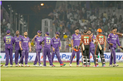
तीन मैच लक्ष्य का पीछा करने वाली टीमों में जीता है। ऐसे में टॉस की भी अहम भूमिका रहेगी। इस मैच पर औसत स्कोर

कोलकाता। यहां के इंडियन गार्डन में गुरुवार को कोलकाता नाइट राइडर्स (केकेआर) और सनराइजर्स हैदराबाद के बीच मुकाबला होगा। दोनों ही टीम अपने-अपने शुरुआती मुकाबले में हारी हैं, ऐसे में दोनों का ही लक्ष्य इस मैच में बेहतर प्रदर्शन कर जीत दर्ज करना होगा। पिछले आईपीएल सत्र में इन दोनों ही टीमों के बीच कुल दो मुकाबले खेले गए हैं जिसमें से एक केकेआर और एक सनराइजर्स हैदराबाद ने जीता था। इनके बीच अंतिम बार मुकाबला दिल्ली के अरण जेटली स्टेडियम में हुआ था जिसमें सनराइजर्स हैदराबाद की टीम ने केकेआर को आसान से हाथिया था। केकेआर को इस बार कोलकाता में अपने घरेलू मैदान का लाभ मिल सकता है। इस मैदान पर खेले गए अंतिम आठवीं पांच टी20 मैचों में से