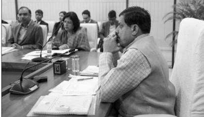
टॉप-टू-बॉटम नई जमावट

भोपाल। प्रदेश में नई सरकार बनने के बाद से बैंकड़ों आईएसएस-आईपीएस अधिकारियों के तबादले किए गए हैं। सुर्जों का कहना है कि अधिकारियों तबादले लोकसभा चुनाव के कारण चुनाव आयोग को गाइड लाइन के अनुसार हुए हैं। ऐसे में 4 जुनू को लोकसभा चुनाव के परिणाम आने के बाद मुख्यमंत्री डॉ. मोहन यादव अफसरों की अपनी टीम बनाएंगे। वही प्रशासन में विकास की रफ्तार को तेज किया जाए और कानून व्यवस्था को और मजबूत बनाया जाए।