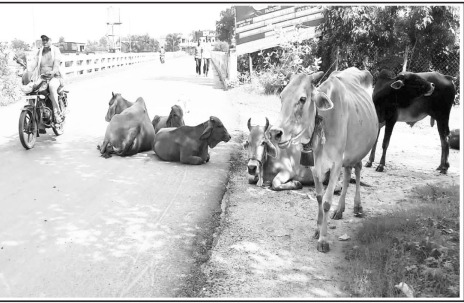
आवारा मवेशी - सिलेकर

पकड़कर भेजे गौशाला लालबर्बा मुख्यालय सहित ग्रामीण क्षेत्रों में भी आवारा मवेशी सड़कों पर घूमते रहते हैं जिससे आवागमन भी बाधित होता है साथ ही फसलों को भी नुकसान पहुँचाते हैं। एवं सभी ग्राम पंचायतों में आवारा मवेशियों के लिए कर्जौडी हाऊस बनाकर दे जहाँ पर किसान अपनी खेतों की नुकसानी करने वाले आवारा मवेशियों को लाकर बंद कर देते थे जिन्हें पशु मालिक के द्वारा जुर्माना की राशि देकर छुड़ाया जाता था। जिससे पशुमालिक अपने पशुओं को आबारा छोड़ने से बचते थे और अपने पशुओं को सुरक्षित घर पर ही बाँधकर रखते थे परन्तु वर्तमान समय में अधिकांश पंचायतों में कर्जौडी हाऊस नजर नहीं आ रहा है। जिसके कारण भी पशुमालिक अपने मवेशियों को लाकर छोड़ रहे हैं और यही मवेशी नगर मुख्यालय सहित ग्राम पंचायत कंजई से लेकर गरी हाईवे मार्ग में जगह-जगह शांति के बाद धमाचौकड़ी मचाते हुए नजर आ रहे हैं। साथ ही आवारा मवेशियों के धमाचौकड़ी के कारण पूर्ण में दुर्घटनाएँ भी घटित हो चुकी हैं जिससे कई लोग काल के गाल में समा चुके हैं और वर्तमान समय में भी राजाणा छोटी-मोटी दुर्घटनाएँ घटित हो रही हैं। उसके बावजूद भी प्रशासन आवारा मवेशियों को पकड़कर गौशाला भेजने एवं पशु मालिकों पर कोई कार्यवाही नहीं कर रहे हैं जिससे सभी में आक्रोश व्याप्त है।