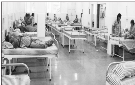
इंतजार कर रही हैं जिसका एक छोटा सा उदाहरण 23 अप्रैल को जिला चिकित्सालय में देखने को मिला जहां पर आज से 6 महीने पहले प्रसूति महिला द्वारा प्रसव करवाया गया था किंतु आज तक उन्हें शासन की योजना का लाभ नहीं मिला है और उनके खाते में अभी तक राशि नहीं आई है जब हमने इस विषय को लेकर निम्नोदारी से चर्चा करनी चाही तो उन्होंने भी अपने हाथ खड़े कर दिए और इस विषय में कुछ भी नहीं कहना चाहते, जबकि देखा जाए तो लगभग 3 हजार ऐसी हितग्राही महिलाएं हैं जिन्हें इन दिनों योजनाओं का लाभ अभी तक नहीं मिला है।

जिले की 3 हजार से अधिक हितग्राही महिलाएं एक वर्ष से अपने खाते में राशि आने का कर रही इंतजार