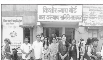
किशोर न्याय बोर्ड में महाविद्यालय की छात्राओं को कराया गया भ्रमण