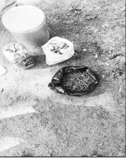
हालत में बरामद कर अपनी अभिरक्षा में रख लिया है। प्राप्त जानकारी के अनुसार आबकारी विभाग को मुखबिर

वारासिन्वी (पद्मेश न्यूज)। नगर के वार्ड नंबर ५ बस स्टैंड में स्थित पुलिस क्वार्टर के पास नगर निरीक्षक के निवास से कुछ दूरी पर करीब डेढ़ किलो प्रतिबंधित मादक पदार्थ गांजा आबकारी पुलिस ने लावारिस