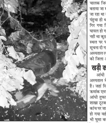
अधिकारिक शक्ति उतनी पड़ी है।

लांजी (पद्मेश न्यूज़)। लांजी क्षेत्र में 23 अप्रैल रात्रि 9 बजे आंधी तूफान ने चंडोर तवाही मचाई है जहां भारी मात्रा में माल की हानि हुई है वहीं शारिरिक