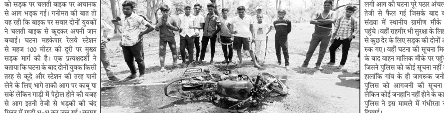
कि टीक तरीके से बात भी नहीं कर पा रहे थे। सर्किट होने से हीरो होइख कंपनी के पेंशन

कटगो (पद्मेश न्यूज़)। तिरिडो तहसील जा रहे थे। वह इस घटना के बाद इतने डर गए बाहन दिग्धा निवासी का बताया जा रहा है। शार्ट वाहन में आग लगने का अनुमान लगाया जा रहा है, मुख्य सड़क मार्ग पर चलती बाइक में लगी आग की घटना पूरे पुर अंचल में तेजी से फैल गई जिसके बाद बड़ी संख्या में स्थानीय ग्रामीण मौके पर पहुंचे। वहीं राइडर भी सुरक्षा के लिहाज से कुछ दूर के लिए सड़क की दोनों ओर रुक गए। वहीं घटना की सूचना मिलने के बाद वाहन मालिक मौके पर पहुंचा। जिसने पुलिस को कोई सूचना नहीं दी। हालांकि गांव के ही जागरूक जनों ने पुलिस को आगजनी की सूचना दी लेकिन कोई जवाब नहीं होने के कारण पुलिस ने इस मामले में गंभीरता नहीं दिखाई।