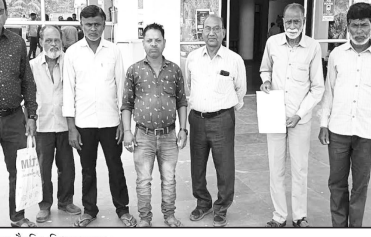
आगे बताया है कि विभाग द्वारा टावर लाइन डालने का सर्वे कर किया गया इसकी कोई जानकारी नहीं दी गई, ना ही ग्रामीणों से अनुमति ली है। हमें ऐसा लग रहा है कि सरकार अपनी मनमाजी कर रही है। जो नहीं होनी चाहिए।

बालाघाट (पट्टमेश न्यूज़)। जिला मुख्यालय से करीब 8 किलोमीटर दूर ग्राम पंचायत धनसुआ से आठ आधा दर्जन से अधिक ग्रामीणों ने कलेक्टर कार्यालय में एक ज्ञापन सौंपा है जिसमें उन्होंने फिरफराप से ग्राम भवनेली के लिए जाने जाई जा रही 132 केबी की टावर लाइन को गांव बस्ती के समीप से हटाने की मांग की है। कलेक्टर कार्यालय में सौंपे गए इस ज्ञापन में ग्रामीणों ने सुरंग जिले में टावर लाइन से हुए हादसे का जिक्र करते हुए इस लाइन से लोगों के जान माल का खतरा बताया है। जिन्होंने टावर लाइन को गांव बस्ती मकान या रहवासी क्षेत्र के समीप से ना ले जाने की मांग करते हुए उसे शासकीय भूमि से ले जाने की गुहार लगाई है। जिन्होंने मांग पूरी न होने पर इसकी उच्च स्तरीय शिकायत करके जाने की चेतावनी दी है।