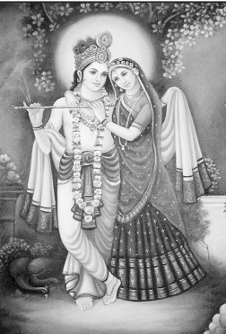
पावन अवसर पर शिव मंदिर समिति के तत्वाधान में

लालबर्सा (पद्मेश न्यूज़)। नगर मुख्यालय से लगभग १५ किमी. दूर ग्राम पंचायत बुढ़ा ह. स्थित पुरातन शिव मंदिर परिसर में महाशिवरात्रि पूर्व के