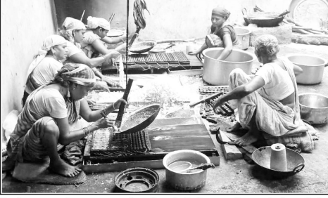
जिसके दुकानदार भी मायूस नजर आये। वहीं २४ मार्च को व्यापार उठने को उम्मीद व्यापारियों को है।

लालबरा (पद्मेश न्यूज)। हिन्दू धर्मावलम्बियों का ५ दिवसीय रंगोत्सव होली का त्यौहार २४ मार्च को होलिका दहन के साथ प्रारंभ हो जायेगा एवं २५ मार्च को धुरेडी रंगोत्सव का तैयार मनाया जायेगा। जिसकी तैयारी हिन्दू धर्मावलम्बियों के द्वारा कर ली गई है जिसके द्वारा रंगविवार को शुभ-मुहूर्त पर होलिका दहन किया जायेगा। होली त्यौहार को लेकर नगर मुख्यालय में रंग-बिरंगी पिचकारी, गुलाल, टोपियां, मुछोटों व बताशों के मालों से बाजार सज चुकी है और क्षेत्रीयजन पहुंचकर खरीदी कर रहे हैं। वहीं इस बार बच्चों को लुभाने के लिए विभिन्न डिजाइन की पिचकारियां बाजार में उपलब्ध हैं परन्तु बाजार में रौनक कम नजर आ रही है जिसका मुख्य कारण महंगाई को माना जा रहा है। वहीं कुछ दुकानदार तो दुकान सजाकर ग्राहक का इंतजार करते भी नजर आये बिनाका कहना है कि होली पर्व को लेकर सामग्री की खरीदी कर लिये है परन्तु को तो शेष एक दिन बचा है, व्यापार बहुत मंदा चल रहा है। जितनी राशि का सामान खरीदी कर लाये है उतना निकलना भी मुश्किल है। इस तरह बहती महंगाई के कारण व्यापारियों का व्यापार घट चुका है। जिसे उम्मीद है कि होलिका दहन के दिन २४ मार्च को व्यापार में उछाल आ सकता है इसीलिए दुकानदारों के द्वारा रंग-गुलाल, रंग-बिरंगी पिचकारी एवं बताशों की माला से दुकानों को सजा ली गई है और क्षेत्रीयजन पहुंचकर खरीदी भी कर रहे हैं।