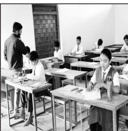
उल्लसितिकाओं का मूल्यांकन कार्य भी जारी है और अंतिम चरण में वार्षिक परीक्षा का परिणाम भी घोषित किया जायेगा जिसकी तैयारी में शिक्षा विभाग जुट गया है। इसी कड़ी में नगर मुख्यालय स्थित शासकीय उत्कृष्ट उत्तमर माध्यमिक विद्यालय में २३ मार्च को कक्षा नवमीं के २५७ विद्यार्थियों ने विज्ञान विषय का परीक्षा का कक्षा नवमीं के २५७ विद्यार्थियों ने अंग्रेजी विषय का दोहरा २ बजे से शाह ५ बजे तक शॉपिंगपूक तरीके से प्रश्नपत्र हल किये। जिसके साथ ही उनकी वार्षिक परीक्षा संपन्न हो चुकी है। परीक्षा संपन्न होने के बाद अब छात्र-छात्राओं को वार्षिक परीक्षा परिणाम को फिंता सानते लगी हैं। आएको बता दे कि लोक शिक्षण संचालनालय भोपाल के निर्देशानुसार कक्षा ९ वीं एवं ११ वीं की

वार्षिक परीक्षा गत ६ मार्च से शुरू हुई थी और अंतिम प्रश्नपत्र के साथ २३ मार्च को संपन्न हो चुकी है। वहीं लोकसभा चुनाव को मद्देनजर रखते हुए लोक शिक्षण संचालनालय भोपाल के द्वारा अप्रैल माह के प्रथम सप्ताह में वार्षिक परीक्षा परिणाम घोषित किये जाने के निर्देश शिक्षा विभाग को दिये गये हैं। जिसके परिणाम में परीक्षा सफल हो उल्लसितिकाओं का मूल्यांकन कार्य शुरू कर दिया गया है और यह कार्य संकुल स्तर पर किया जा रहा है, जिसका कार्य अंतिम चरण में है और अप्रैल के प्रथम सप्ताह में वार्षिक परीक्षा का परिणाम घोषित किया जायेगा। चर्चा में शासकीय उत्कृष्ट उत्तमर।