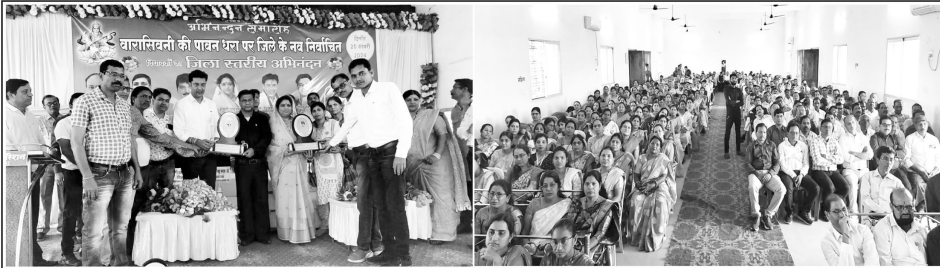
वारासिवनी की पाठ्य धूप पर जिले के नव निर्वाचित विधायकों का अभिनंदन समारोह संपन्न हुआ।