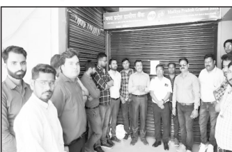
ग्रेयुटी का भुगतान करने सहित अन्य मांगों को पूरा किए जाने की गुहार लगाई है।

इन मांगों को पूरा करने की लमाई गुहार हड़ताल कर्मचारियों को मांग है कि हड़ताल को ग्रामीण बैंकों की मिलाकर राष्ट्रीय ग्रामीण बैंक ही निर्माण किया जाए। इसके अलावा पुानी पेकन को बहाल करने, ईनिक वेतन भोगी कर्मचारों के नियमितीकरण, समय पर प्रोमोशन तथा बैंक में रिक्त पदों में युवाओं की भारी और कंप्यूटर इंटीग्रीटेड को लाू कि जाए सहित अन्य मांगों को लेकर आवाज बुलंद की। तो वहीं उन्होंने बैंक से 20000 से अधिक पद रिक्त है उन्हें तुरत भरा जाए तथा उचित मैनुअलर नीति बनानक नवी भारती की जाए एवं परीक्षित नियमों के बँकाइ इंटरटी के अनुरूप सेमोशन किया जाए, दैनिक वेतन भोगी, पारट टायम कर्मचारी, आउटडोर कर्मचारियों को सेवा में नियमित किया जाए सिलेन नियमों एवं छुट्टी नियमों में संशोधन किया जाए, वेतन समझौते के अनुसार सभी पदों एवं सुविधाओं की समताला लागू की जाए। पेंशन को पुनीत सामंताला लागू की जाए पूर्ण पेंशन से बँवांताओं को पेंशन दी जाए, कंप्यूटर वेतन वृद्धि को पूर्णीत लागू किया जाए, अनुक्रम निरुक्ति प्रभावी तिथि से लागू की जाए सेमोलायनपुरातः प्रभावी मूल