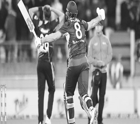
ऑस्ट्रेलिया की ओर से एडम जम्पा ने चार विकेट लिए। नेथन एलिस को दो विकेट मिले। जॉश हेजलवुड, डेव कार्मिच और मिचेल मार्श ने एक-एक बल्लेबाज को आउट किया।

ऑकलैंड। ऑस्ट्रेलिया ने दूसरे टी-20 मुकाबले में न्यूजीलैंड को 72 रनों से हराकर सीरीज में 2-0 की बढ़त हासिल कर ली है। इस मैच में ऑस्ट्रेलिया की जीत में डैविड हेड और एडम जम्पा की अहम भूमिका रही। हेड ने तेजी से 45 रन बनाये जबकि सकेट वाद गेंदबाजी के दौरान जम्पा ने वन विकेट लिए। इस मैच में ऑस्ट्रेलियाई टीम ने पहले बल्लेबाजी करते हुए 174 रन बनाये। इस प्रकार कौची टीम को जीत के लिए 175 रनों का लक्ष्य मिला। इसका पीछा करते हुए कौची टीम 17 ओवर में 102 रनों पर ही सिमट गई।