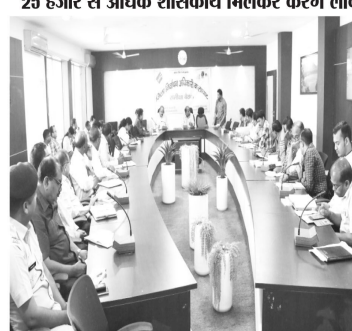
जिला निर्वाचन अधिकारी डॉ.मिनाक्षी कुमार मिश्रा ने प्रारंभिक बैठक कर नौदल अधिकारियों द्वारा अब तक किये गए कार्य के आधार पर आपो कोन-कोन से कार्य किसे तह किये जाने हैं। इन सब मामलों के सम्बंध में निर्देश दिए गए। बड़े आयोजन को तैयारियों के लिए मान संसाधन का कार्य देखा रहे जनसहित कार्य विभाग द्वारा उदा मांगा गया।

बालाघाट (पद्मेश न्यूज)। लोकतंत्र के महापर्व आम लोकसभा निर्वाचन की तैयारियों का दौर शुक्रवार से प्रत्यक्ष रूप से प्रारंभ हो गया है। इस बड़े प्रबंधकीय कार्य को लेकर जिला निर्वाचन अधिकारी डॉ.मिनाक्षी कुमार मिश्रा ने प्रारंभिक बैठक कर नौदल अधिकारियों द्वारा अब तक किये गए कार्य के आधार पर आपो कोन-कोन से कार्य किसे तह किये जाने हैं। इन सब मामलों के सम्बंध में निर्देश दिए गए। बड़े आयोजन को तैयारियों के लिए मान संसाधन का कार्य देखा रहे जनसहित कार्य विभाग द्वारा उदा मांगा गया। जिनके अनुसार जिले में 25052 जिला व पुलिस प्रशासन के शाबकीय सेवक हैं। डीईओ डॉ. मिश्रा ने डीपीएम नौदल अधिकारियों से अब तक हुई एएसएसटी, खराब मशीनों और प्रशिक्षणों में उपयोग में आने वाली मशीनों की जानकारी राजनीतिक दलों को देने के निर्देश दिए हैं। इसके अलावा राजनीतिक दलों को मशीनों के परिवहन की