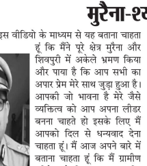
इस बीड़ियों के माध्यम से यह बताना चाहता हूँ कि मैंने पूरे क्षेत्र गुरेना और शिवपुरी में अकेले प्रभम किया और पाया है कि आप सभी का आप प्रेम मेरे साथ जुड़ा हुआ है। आपकी जो भावना है मेरे जैसे व्यक्तित्व को आप अपना लोड बना चाहते हो इसके लिए मैं आपको दिल से धन्यवाद देना चाहता हूँ मैं आज अपने बारे में बताना चाहता हूँ कि मैं ग्रामीण परिक्षेत्र से निकला हुआ व्यक्ति हूँ। मेरे पिता एक किसान और शिक्षक हैं, मेरी शिक्षा ग्वालयर में हुई है। उसके बाद मैं इंजीनियरिंग कॉलेज से पढ़ाई की है। ईश्वर की कृपा हुई कि मैंने बहुत कम उस में आईपीएस परामर्श को रूँक किया और उसमें चयनित हुआ।