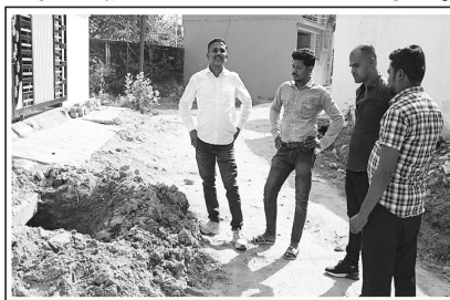
आंदोलन करने की चेतावनी दी है।

बालाघाट पद्मेश न्यूज । नगर में चहुओर विकास का दावा करने वाली नगर पालिका जहां एक ओर बिना भेदभाव के नगर के सभी बाड़ों में कार्य करने का दावा कर रही है, तो वहीं दूसरी ओर नया प्रबंधन पर आए दिनों विपक्षी पार्श्वों के भेदभाव करने और विपक्षी पार्श्वों के बाड़ों का काम नहीं किए जाने का आरोप लगाया जा रहा है। जहां नया नया निर्माण कार्य करना तो दूर पुराने कामों तक की ठीक से सम्पत्त नहीं कर पा रही है। जिसका खामियाजा बाड़ों वसियों को भुगतान पड़ रहा है। जिसकी एक झलक शनिवार को नगर के बाड़ संघ 23 दिनयत्नालय पर फाल्ट होने में देखने को मिली। जहां पिछले 15 दिनों से फूटी पानी की पाइपलाइन को अब तक दुरुस्त नहीं किया गया है। जहां समझा का सजान लेते हुए नया के कर्मचारियों ने पाइपलाइन का फाल्ट सुधारने के लिए बड़ा गड्ढा खोदकर रख दिया है लेकिन पिछले 8-10 दिनों से ना तो फाल्ट सुधार है और ना गड्ढा बुझाया गया। जिसके चलते वहां आए दिन हदसे रहे रहे हैं। जिस पर अपनी नाराजगी जताते हुए विपक्षी पार्श्वों ने गहरे और जतन से सतह पर भेदभाव किए जाने का आरोप लगाया है। तो वहीं उन्होंने दो दिनों के भीतर समस्या का समाधान न होने पर नगर पालिका गेट में ताला जड़कर