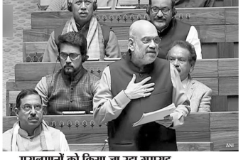
मुलतमानों को किया जा रहा गुमराह

नई दिल्ली। देश में जल्द ही नागरिकता संशोधन अधिनियम यानी सीएए लागू किया जाएगा। इसकी घोषणा केंद्रीय गृह मंत्री अमित शाह ने की है। वहीं उन्होंने आगामी लोकसभा चुनाव को लेकर बड़ा दावा किया है। उन्होंने कहा कि भाजपा को 370 सीटों और एनपीडी को 400 से अधिक सीटें मिलेंगी और प्रधानमंत्री नरेंद्र मोदी के नेतृत्व में लातार तैयारी बार सरकार बनेगी। शाह ने कहा कि लोकसभा चुनाव के मतदानों पर कोई संशय नहीं है और यहां तक कि कांग्रेस और अन्य विपक्षी दलों को भी एएसएम हो गया है कि उन्हें फिर से विपक्षी बेंच में पटना होगा। एक टीवी कार्यक्रम के दौरान